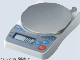
ステンレス皿(別売): HL-200i/2000i用