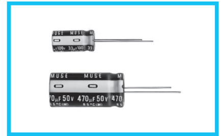
スリーブ色：ブラック