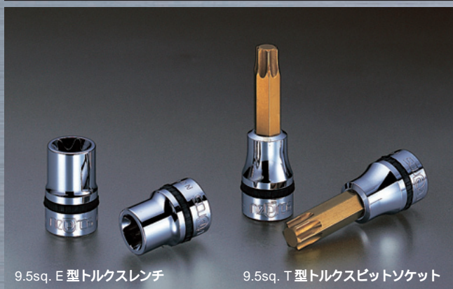
9.5sq. E型トルクスレンチ