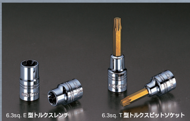
6.3sq. E型トルクスレンチ