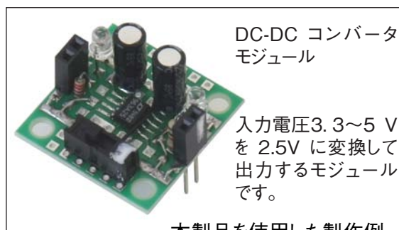
DC-DC コンバータ モジュール