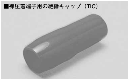
■裸圧着端子用の絶縁キャップ (TIC)