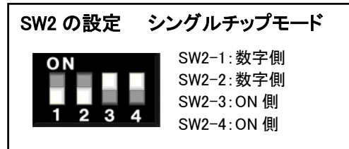
図 3-1 SW2 ジャンパ設定図1