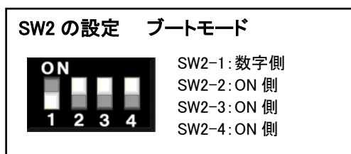
図 3-3 SW2 ジャンパ設定図2

②「Release」フォルダ内の MOT ファイルを FDT を利用して書き込みを行ってください。