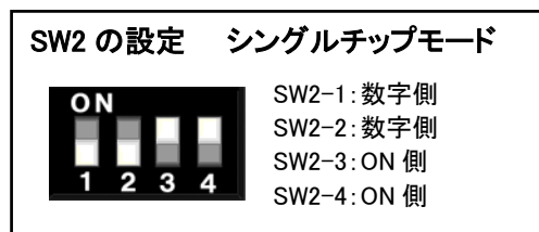
図 3-1 SW2 ジャンパ設定図1