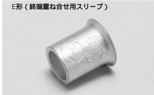
E形 (終端重ね合せ用スリーブ)