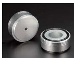
アルミインシュレーターフット AFS・AFMシリーズ P13-11~12