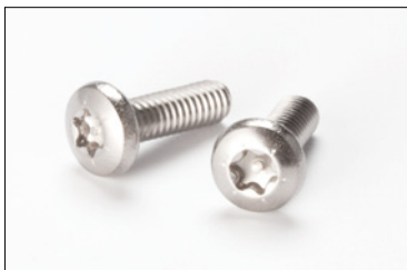
ヘッド形状(ピンあり)