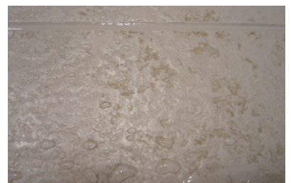
浴室床の油脂汚れ落とし