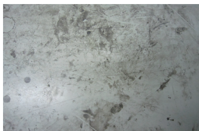
ガムや黒ずみ汚れ落とし