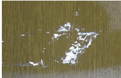
接着剤・テープののり残り除去