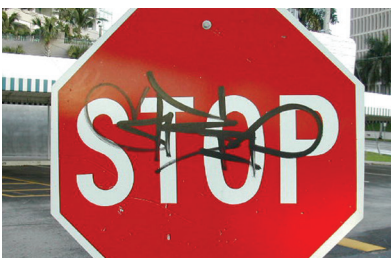
油性ペン落書き跡の消去