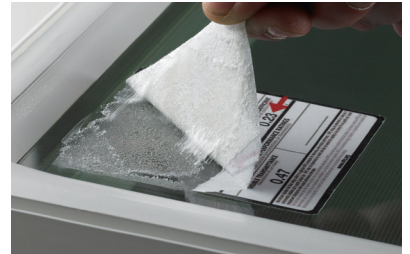
テープ・ステッカー剥がし