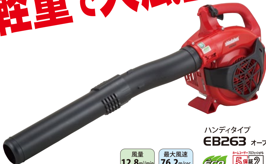
ハンディタイプ EB263 オープン価格