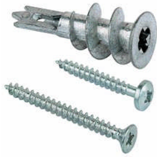
金属製石膏ボード用プラグ GKM