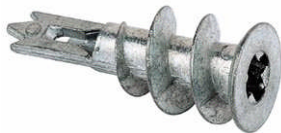
金属製石膏ボード用プラグ GKM