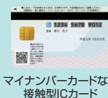
マイナンバーカードなど 接触型ICカード