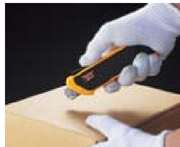
3. 切断後は保護ガードが刃を安全にカバーします。

スライダーを押しっぱなしにした状態であっても保護ガードで刃をカバーし、手やまわりの物を傷つけてしまうことを防止する装置です。