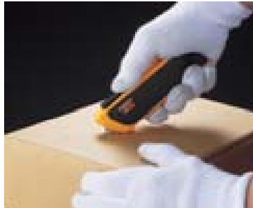
2. 切断を始めると保護ガードのロックが自動的に解除されます。