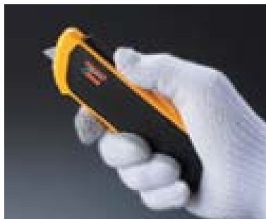
1. スライダーを押して刃を出す。