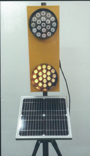
三脚での使用(ソーラー電源)