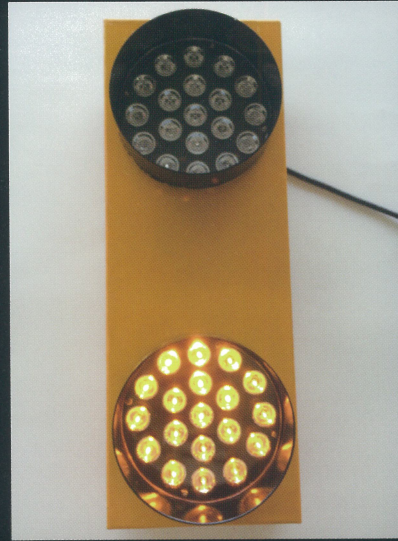
全灯モード(上下交互点滅)