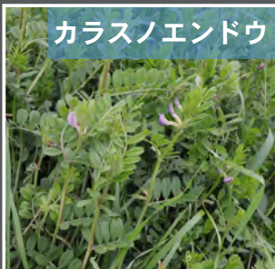
カラスノエンドウ