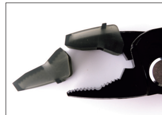
工具不要で簡単着脱樹脂製くわえ部