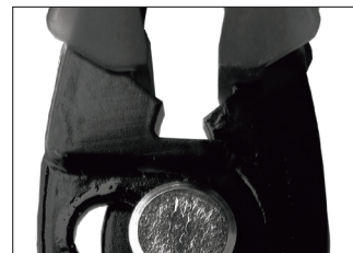
針金や釘などが切れるカッター部 (軟線でφ2.0位まで)

別売り 交換パーツ樹脂も ご用意! No.001 (NPH-165/NH-165用)