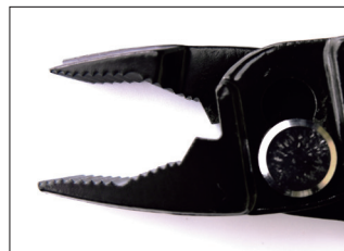
樹脂を外しても使用可能