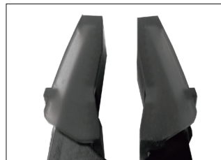
細かい部品もしっかりキャッチ