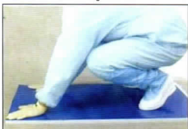
④ マットの底面と床を密着して、使用を始めます。