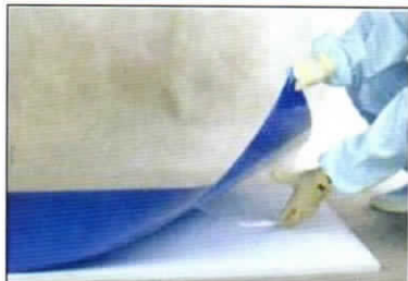
① 底面保護フィルムを1/3剥がします。

●このたびは、 TRUSCO 粘着クリーンマットをお買い上げいただき、誠にありがとうございます。