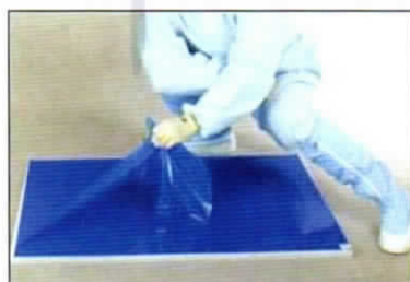
⑦ 3つ目の角から剥がします。