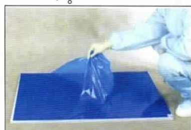
⑥ 隣の角から剥がします。