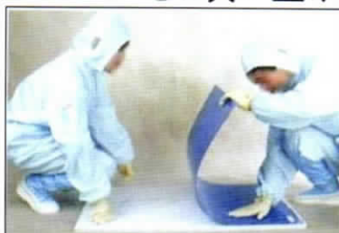
② マットの底面を床に接着します。