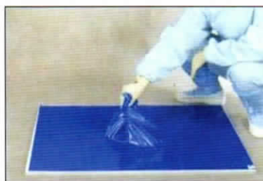
⑧ フィルムでダストを包みます。