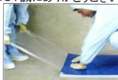
③ 底面保護フィルムを剥がします。