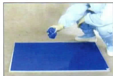
⑨ 使用済みフィルムを処分します。