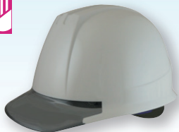
DPM-141JGY/GY (バイザー色:透明グレー)