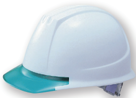
DPM-141JW/GN (バイザー色:透明グリーン)