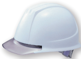
DPM-141JW/GY (バイザー色:透明グレー)