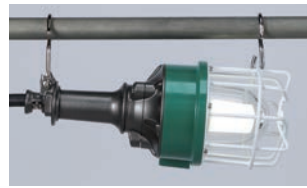
縦吊り・横吊りのできるWフック付