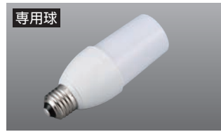
専用球 LDT10型10W LED電球 光の広がり/約300度