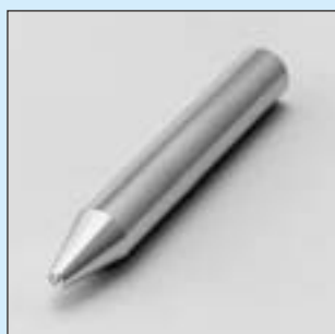
HTX-1 ~ 6