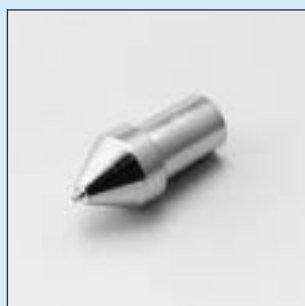
HTX-11 ~ 14