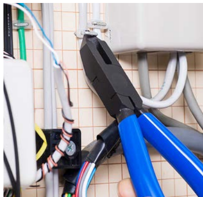
ステップルはずしに