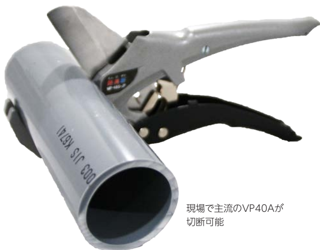
現場で主流のVP40Aが 切断可能