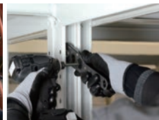
クロスロック 07 設備部材 P.95 ~ 96