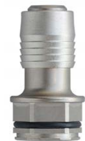
ビットアダプター本体