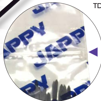
チャック付き袋入り

◀左上から TDK100-50 TDK150-50 TDK200-50 TDK250-50 TDK300-25 TDK380-25