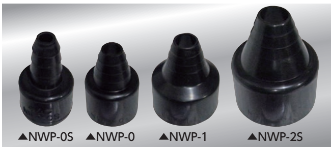
▲NWP-0S ▲NWP-0 ▲NWP-1 ▲NWP-2S