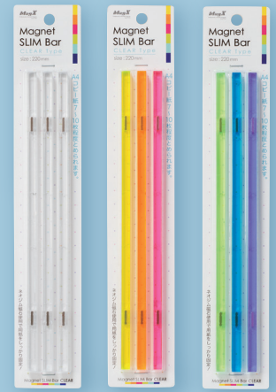
①クリア ②クリア暖色 ③クリア寒色