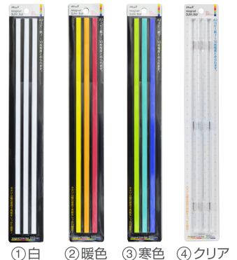
①白 ②暖色 ③寒色 ④クリア