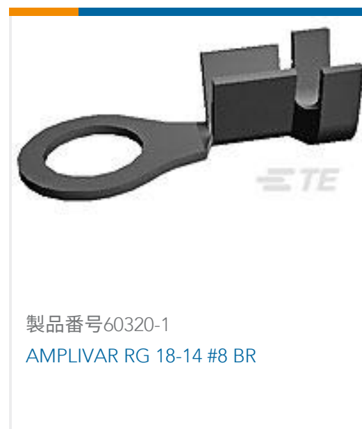
製品番号 60320-1 AMPLIVAR RG 18-14 #8 BR