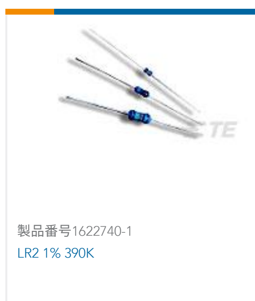
製品番号 1622740-1 LR2 1% 390K