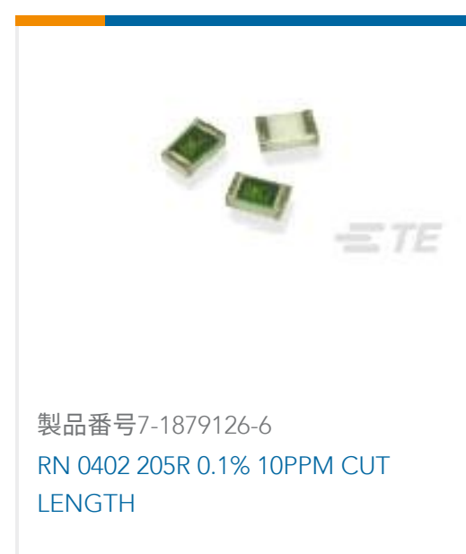
製品番号 7-1879126-6 RN 0402 205R 0.1% 10PPM CUT LENGTH