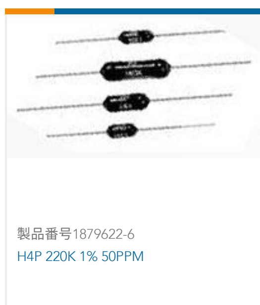
製品番号 1879622-6 H4P 220K 1% 50PPM