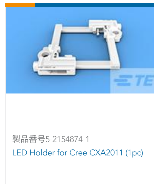
製品番号 5-2154874-1 LED Holder for Cree CXA2011 (1pc)