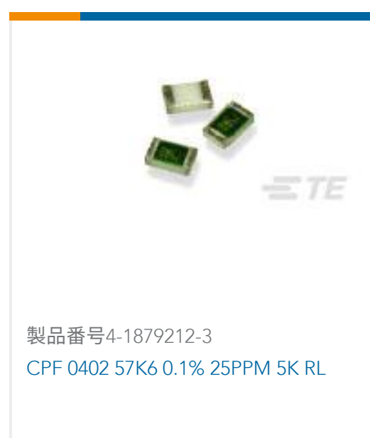
製品番号 4-1879212-3 CPF 0402 57K6 0.1% 25PPM 5K RL