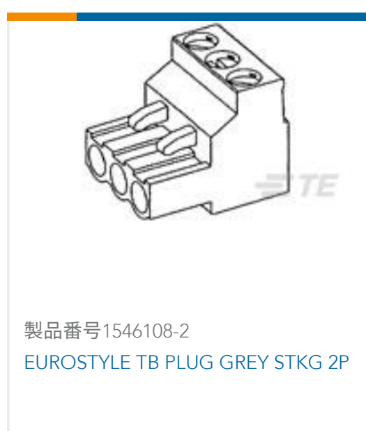
製品番号 1546108-2 EUROSTYLE TB PLUG GREY STKG 2P