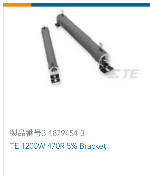
製品番号 3-1879454-3 TE 1200W 470R 5% Bracket