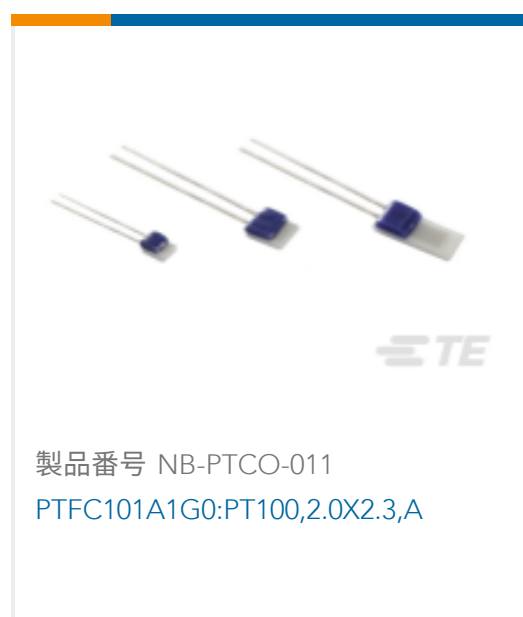
製品番号 NB-PTCO-011 PTFC101A1G0:PT100,2.0X2.3,A