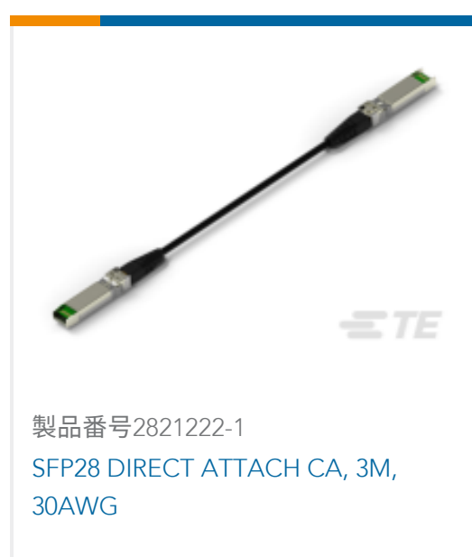
製品番号 2821222-1 SFP28 DIRECT ATTACH CA, 3M, 30AWG