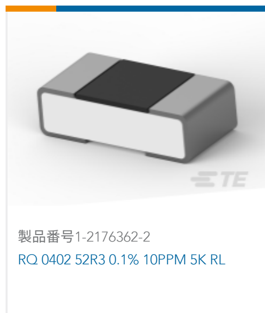
製品番号 1-2176362-2 RQ 0402 52R3 0.1% 10PPM 5K RL