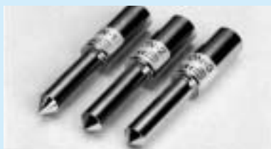
PON-1, PON-2, PON-3