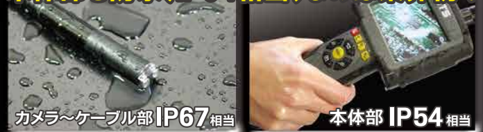
カメラ~ケーブル部 IP67相当

内蔵メモリ(128MB)の他 MicroSDカード(別売)にも 静止画・音声付動画データを記録可能