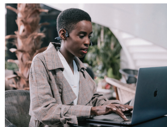
イヤホンによる耳のトラブルリスクを軽減