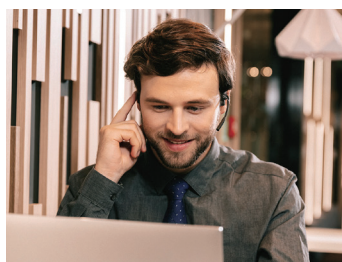
ボタンはひとつ。機能はマルチ。片手で操作OK 着脱簡単なマグネット式充電ポート