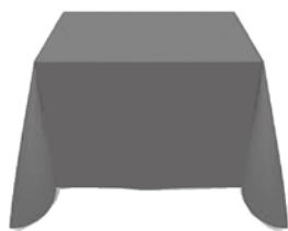
■ 梱包材のカバーなどに