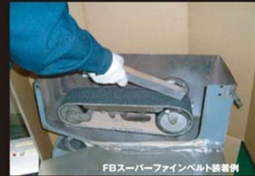
FBスーパーファインベルト装着例