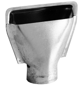
扇型 シュリンクフィルムの収縮などに