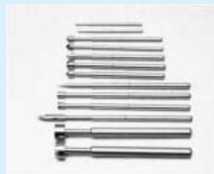
スプリング プローブ