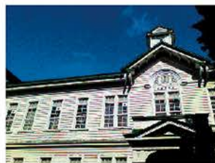
デジタルカメラモード

MSX ® 機能(スーパーファインコントラスト機能)は、リアルタイムで画像を補正することができ、構造物の詳細や発熱箇所の判別が熱画像上で容易に行えます。また、デジタルカメラモードとの同時撮影も可能で、同画角の可視画像を簡単に生成することができます。