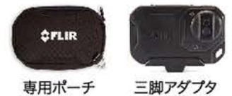
専用ポーチ 三脚アダプタ