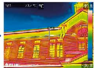
MSX ® モード