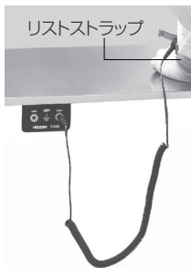
F-154 リストストラップの接続例