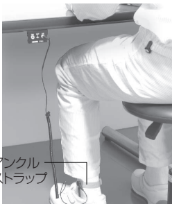
F-142 アンクルストラップの接続例