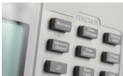
図1. メモリへのセーブ／リコール機能

U8030シリーズは、ニーズに合わせたさまざまな機能と使いやすさを兼ね備えています。LCDディスプレイには1つの画面に電圧と電流の両方が表示されます。また、各出力にオン／オフ・ボタンがあり、複数の出力を同時に制御できます。さらに、自動トラッキング機能により、出力1と2の間の電源電圧シーケンスが簡単にできます。これらの便利で使いやすい機能により、ベンチ用電源として安定した性能を発揮します。