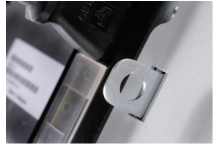
物理的なロック機構

主要な安全機能： 過電圧保護(OVP)/過電流保護(OCP)、 キーパッド・ロックと物理的なロック機構