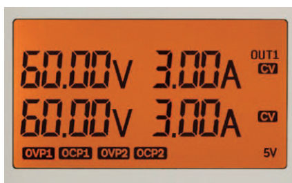
図2. LCDディスプレイには電圧と電流の両方を表示。バックライトのオン／オフが可能