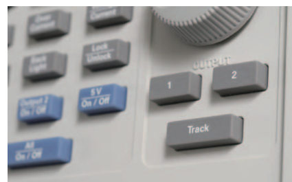
図3. 電源電圧シーケンスを簡単に同期できるトラッキング機能