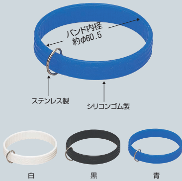
工具落下防止用リストバンド