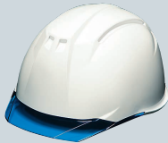
白(バイザー:ブルー)