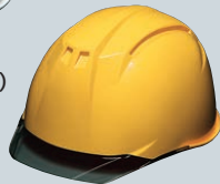
黄(バイザー:スモーク)