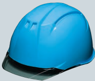
青(バイザー:スモーク)