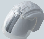
スチロール& シールドセット