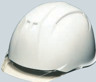
白(バイザー:クリア)