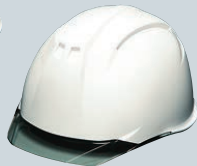
白(バイザー:スモーク)