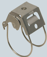
被覆付ワイヤー用