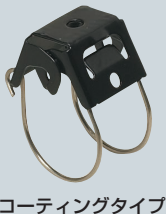
コーティングタイプ