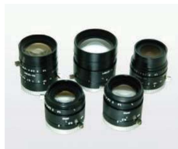
1インチ撮像素子用VS-H1シリーズ