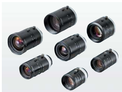
2/3インチ撮像素子用SV-Hシリーズ