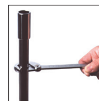
配管パイプの締め付け