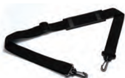
ショルダーベルト SB1250