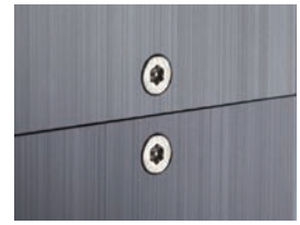
ヘキサロビュラビス MR-11 P13-46