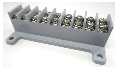
端子台 単体の画像